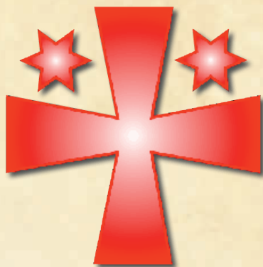
Lo stemma dei Cavalieri Gaudenti.