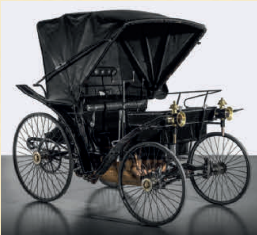
La Peugeot Type 3, numero di telaio 25, prima auto a circolare in Italia.